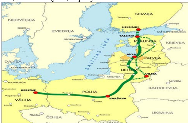
Рис. 6. – Планируемый маршрут Baltica Rail [6].

Маршрут Baltica Rail выглядит следующим образом: Финляндия (Хельсинки) – Эстония (Таллин - Пярну) – Латвия (Рига) – Литва (Бауска – Паневежис - Каунас - Вильнюс) – Польша (Белосток - Варшава) – Германия (Берлин – Гамбург). Более наглядно это выглядит на следующем рисунке: