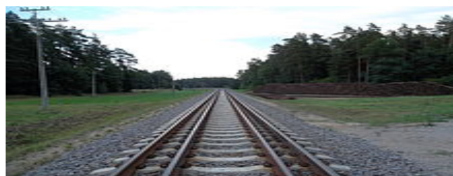
Рис. 7. – Ж/д путь со сменной колеей (1435 мм – 1520 мм)

Отдельно хочется затронуть тему подводного тоннеля между г. Хельсинки (Финляндия) и г. Таллин (Эстония). Данный тоннель будет спроектирован под дном Финского залива. Тоннель, по подсчетам технических специалистов Baltica Rail будет протяженностью в 60-80 км. Ещё одним преимуществом в транзитном времени здесь будет являться ширина колеи. У железных дорог Финляндии и Эстонии ширина колеи составляет 1520 мм, однако было принято решение, что на данном участке будет 1435 мм (как и в странах Европы). Это сделано для того, чтобы без перегруза продолжить движение. На маршруте Шяштокай (Литва) – Моцкава (Литва) разработчики построили железнодорожный путь с разной колеей для того, чтобы движение также не останавливалось.