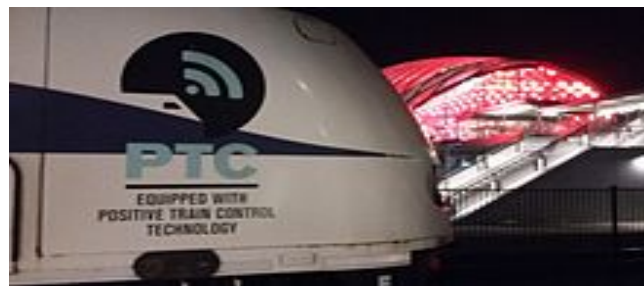
Рис. 5- Локомотив, оборудованный PTC [3]

7. PTC (Positive Train Control). Представляет собой систему функциональных требований для контроля и управления движением поездов и является типом системы защиты поездов. Подвижной состав может двигаться только в случае положительного допуска движения. Это в целом повышает безопасность железнодорожного движения.