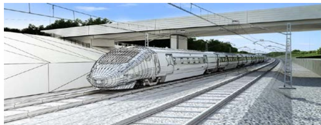
Рис. 4 – Обзор поезда в BIM [3].

своевременную эксплуатацию и ремонт благодаря сбору и комплексной обработке архитектурно-конструкторской, технологической, экономической и иной информации об активе со всеми её взаимосвязями и зависимостями. Вовремя произведенный технический контроль и осмотр подвижного состава и железнодорожной инфраструктуры способствует устранению неполадок, тем самым минимизируя процент поломки и несчастных случаев во время перевозки;