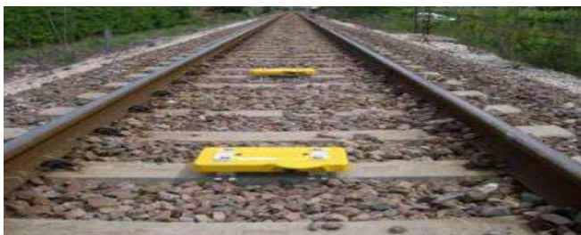
Рис. 1 – Изображение оборудования на железнодорожных путях [3]

исходя из ситуации в реальном времени. Преимущество датчиков еще и в том, что они смогут передать информацию о состоянии поезда и незаконно проникнувших в данный подвижной состав. Тем самым, есть возможность предотвращения кражи. Оборудование и датчики выглядят следующим образом: