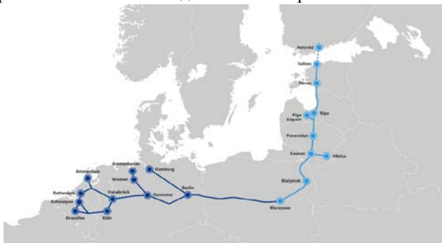
Рис. 7 – Окончательный маршрут Baltica Rail [6].

Однако это лишь первоначальный вариант. Впоследствии, разработчики хотят удлинить данный проект, окончательно соединив Западную Европу с Прибалтийскими и Скандинавскими странами.