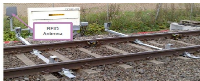
Рис. 2 – RFID-датчик [3]

3. Модель торможения при обнаружении препятствия. Инициатором данной модели выступила известная компания Network Rail – одна из инициаторов и поставщиков современных технологий на железнодорожный рынок. Модель анализирует ситуации благодаря следующей информации: